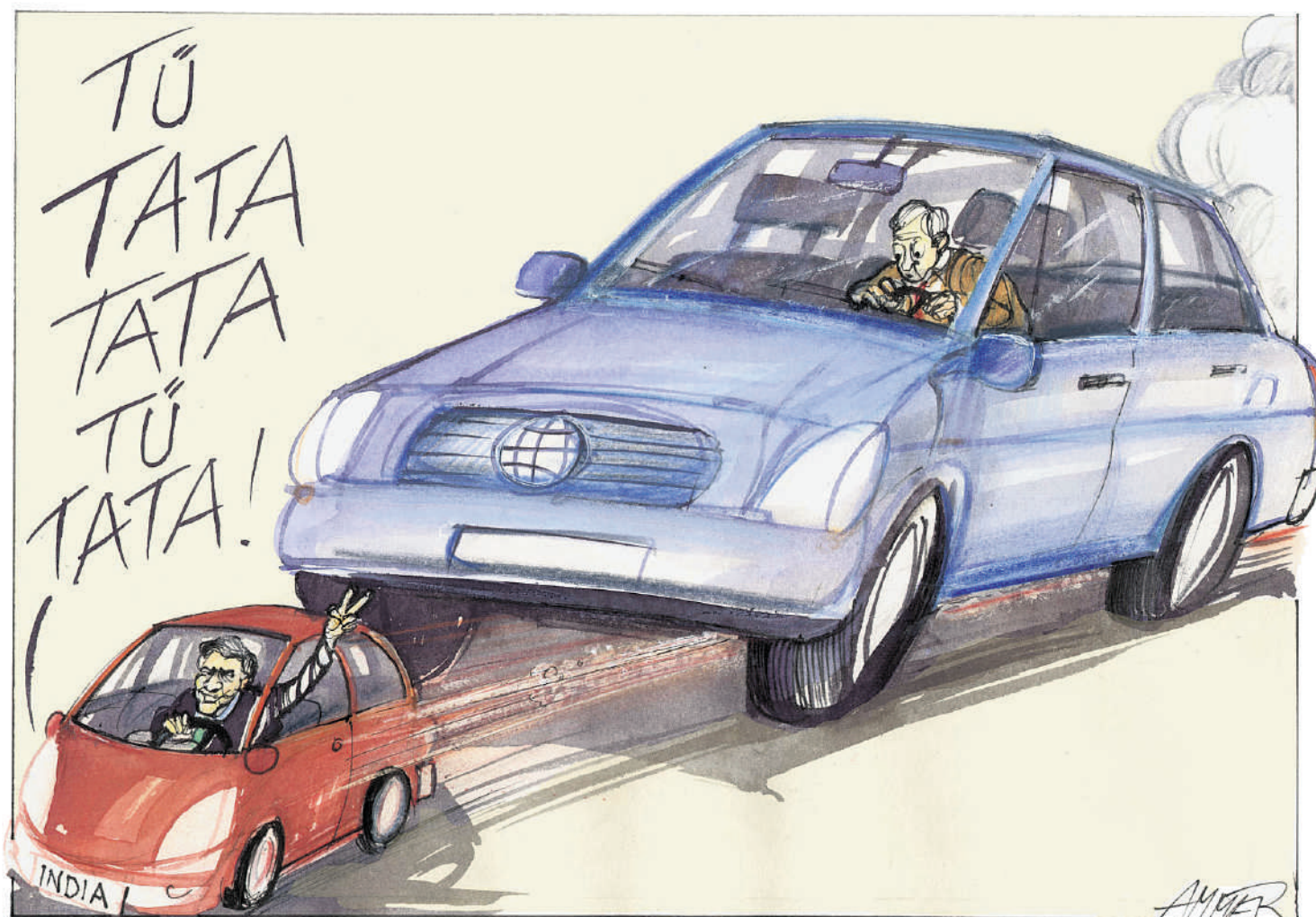
Tekening Wolfgang Ammer

De Indica is samen met de Tata Safari SUV nieuw in bepaalde delen van Europa – vooral in Groot-Brittannië, waar de Indica als het nieuwe merk CityRover werd verkocht.